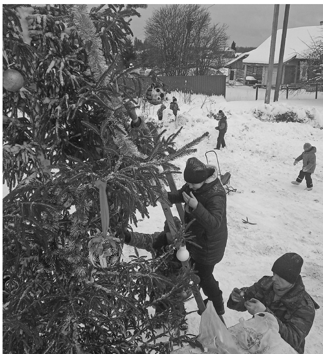
Жители Васильевского и окрестных деревень нарядили ёлку. К встрече Нового года – готовы!